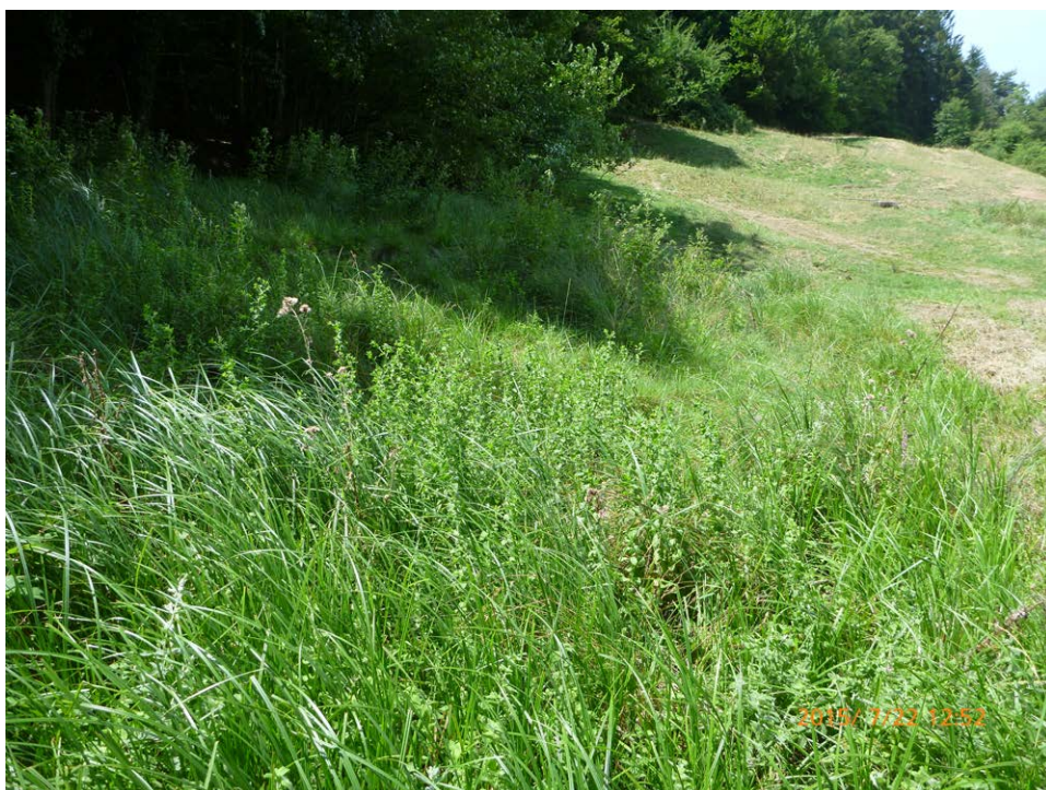
Photos de l'objet 22.07.2015